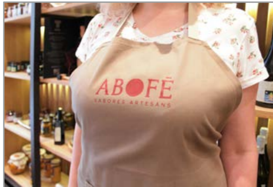
Tarjeta de visita Delantal