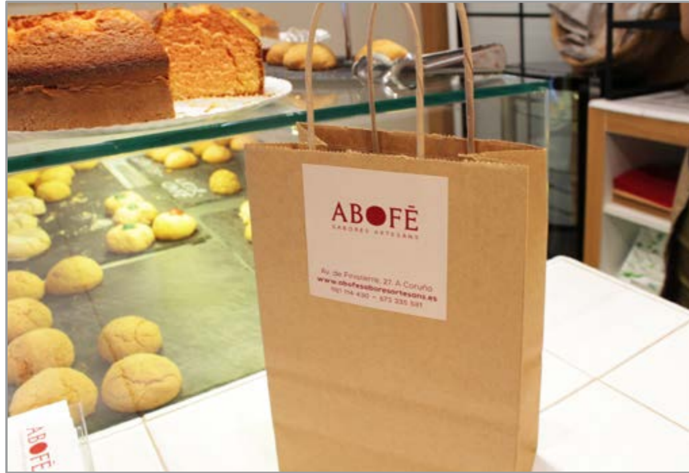
Packaging Pegatina para packaging