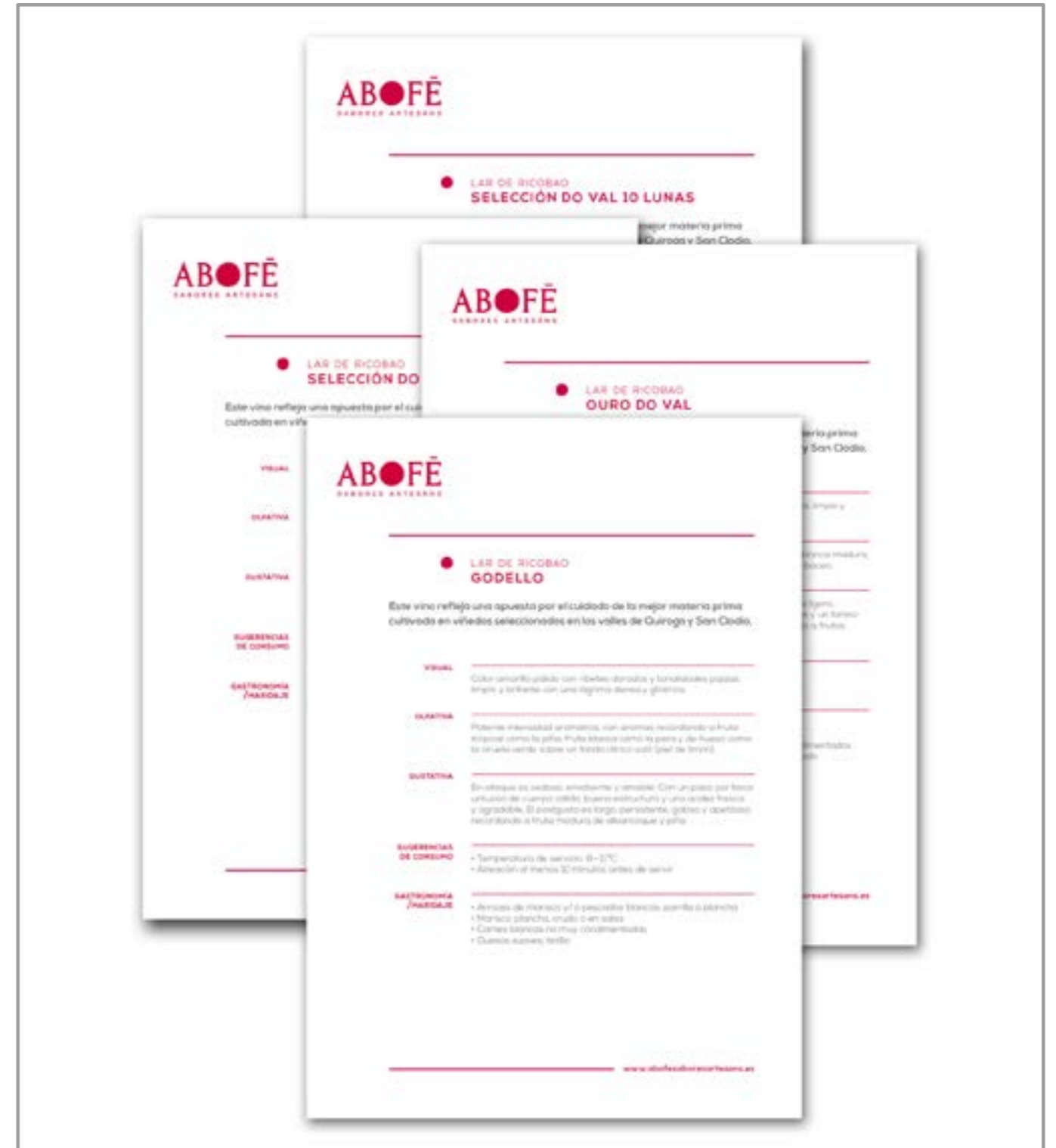
Ficha técnica de producto